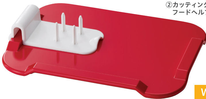
②カッティングボード フードヘルプ付き

3方向に取り付けられるフードヘルプや、まな板のへりを使って食材を固定することで、片手でも調理できます。