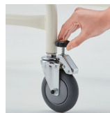
進む速度を調整できます