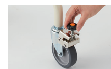
歩行速度の調整ができる抵抗器付き