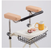
マットに腕を乗せた状態で小物も選べます