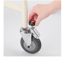
使う方に合わせて歩行速度を調整でき、安心です