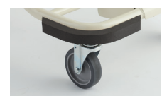
家具や壁などを傷つけにくいバンパー付き

●サイズ／幅50×奥行51.5×高さ79～106cm(無段階調整)、馬蹄内幅：30.5cm ●折りたたみ不可 ●重量／約11.7kg ●材質／フレーム：スチール ●抵抗器付