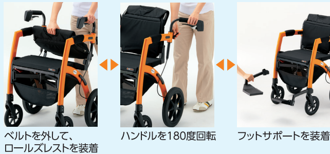
ベルトを外して、 ロールズレストを装着