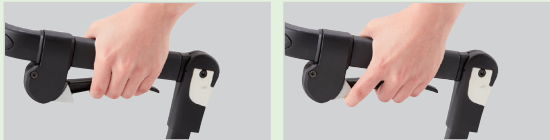
走行時(黒いレバーを握る)

走行中はブレーキレバーを握って、座面に座るときや駐車時には白いレバーも押し上げてブレーキをかけます