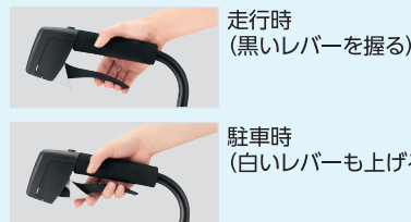
走行時 (黒いレバーを握る)

走行中はブレーキレバーを握って、座面に座るときや駐車時には白いレバーも押し上げてブレーキをかけます。