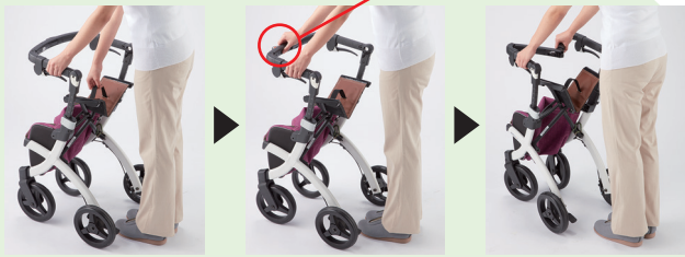
シートの取っ手を引き上げる