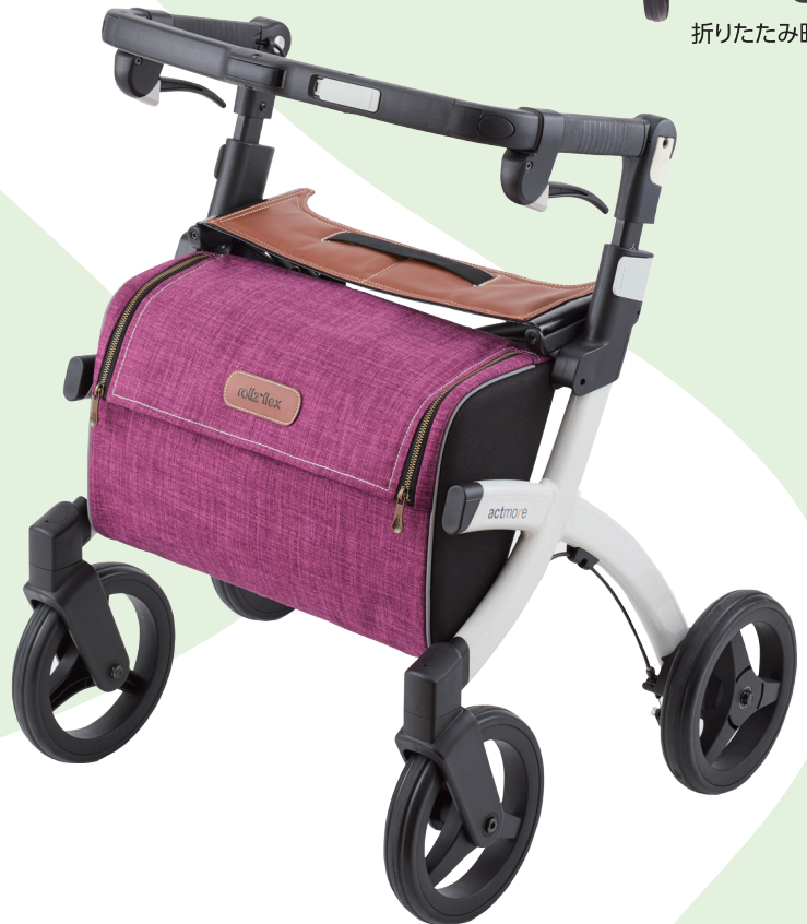
駐車時(白いレバーも上げる)